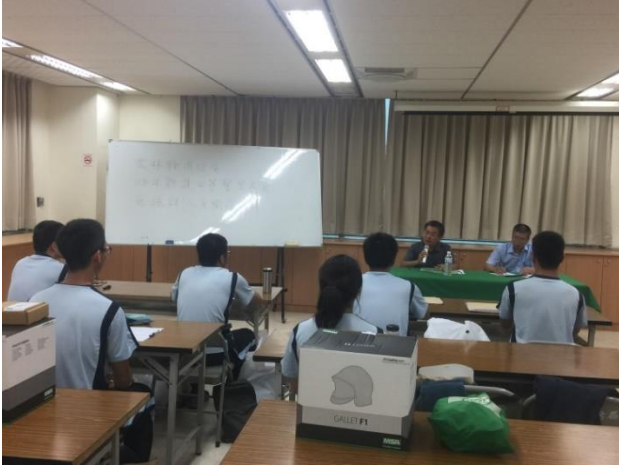
新進人員(警專畢業生)職前講習