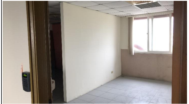
六合小隊女性空間配置