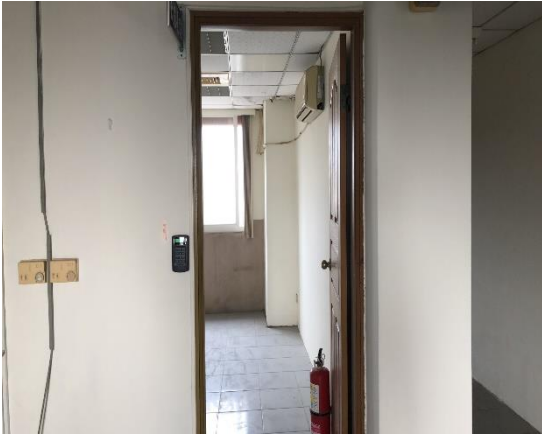
六合小隊女性空間配置