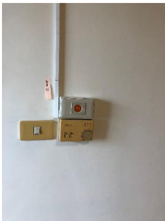
六合小隊女性空間配置