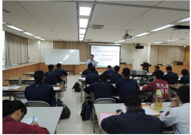
特考班新進人員職前講習