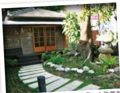
故事館前面花團錦簇，聽完故事，小孩們亦可在這遊戲。

來到這兒，首先你看到的是「虎尾郡守官邸」，這棟美麗的木造建築是本地最高級的「屋敷」（意即高級別墅），也是位階最高的郡守大人住處，在日治時期不能隨便進出。而現在，這裡是「雲林故事館」，一個說故事、聽故事的地方，每週三、六下午，「雲林故事人協會」的志工們會在這裡，為眼神晶亮的孩子們，訴說引人入勝的故事，讓這個素雅的日式空