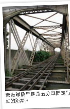
糖廠鐵橋早期是五分車固定行駛的路線。

經過，往熱鬧的虎尾第一街（中山路）走去。街上各種商店雲集、人來人往，記得到百年歷史的正文堂或明文堂刻印店，請老師傅為你刻一方書法布局的珍貴手刻章，然後到中正路口棉被行走廊下的豆花店，喝一碗純手工香濃的粉粿豆花，仔細咀嚼出粉粿中那股淡雅的中藥香。