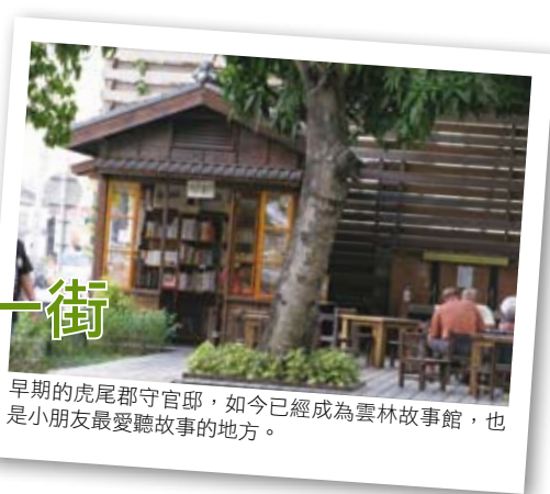
早期的虎尾郡守官邸，如今已經成為雲林故事館，也是小朋友最愛聽故事的地方。