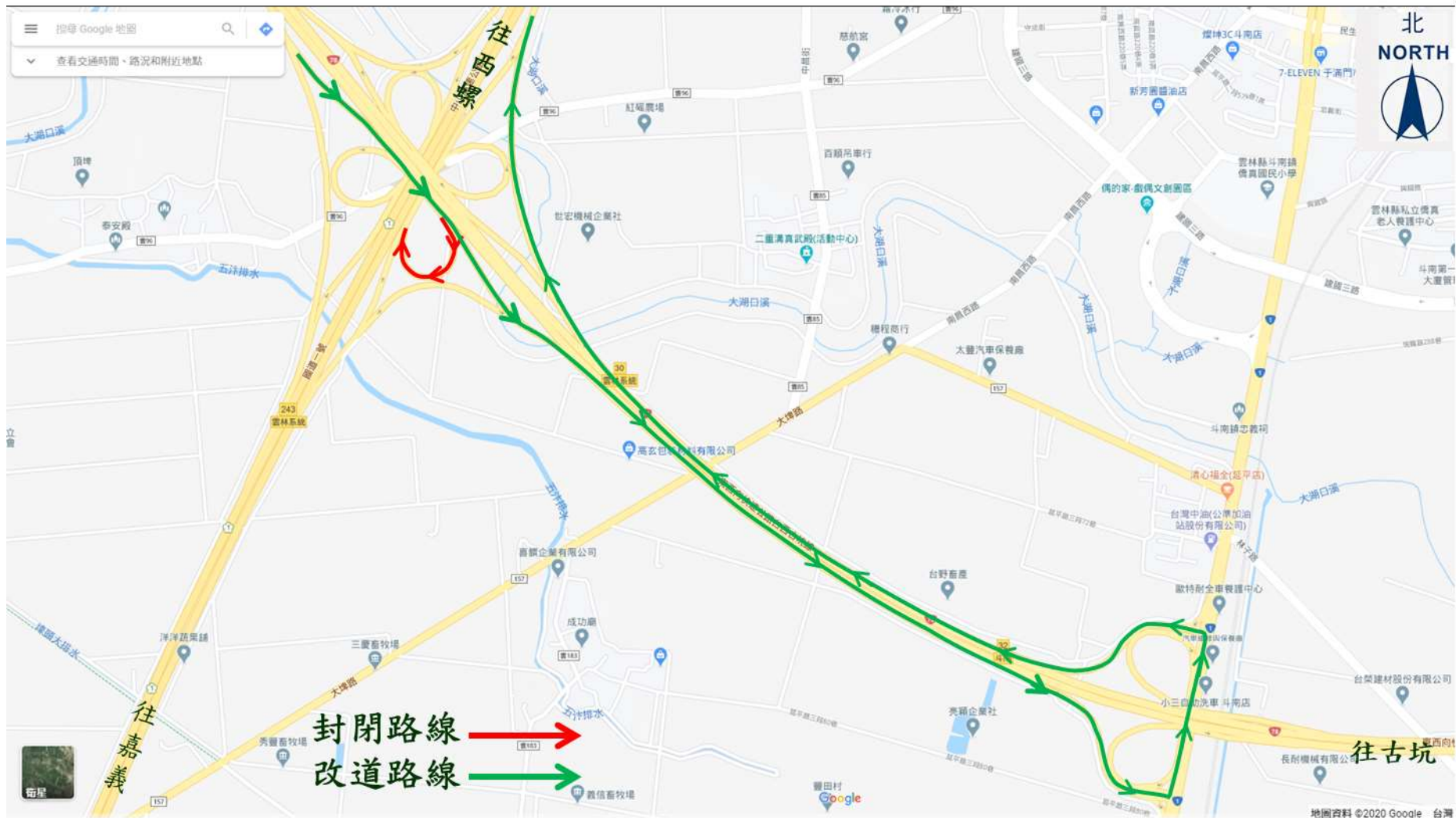
(圖二)台 78 線東行往國道 1 號雲林系統交流道北上入口環道封閉改道路線圖