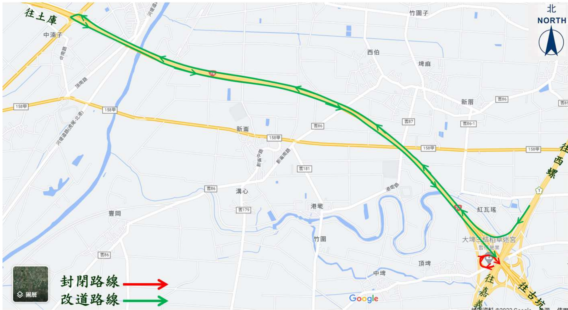
(圖一)國道1號雲林系統交流道出口環道(東行往台78線古坑方向)改道路線圖