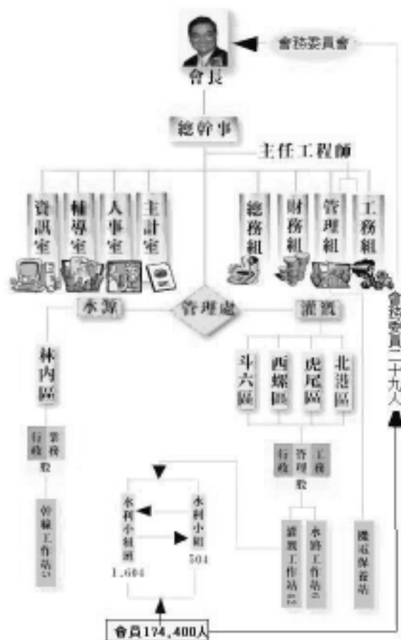
圖 5-2 雲林農田水利會組織系統

會長下設總幹事 1 人，襄助會長處理會務，由會長就具有水利工程學識經驗或水利行政經驗者，遴選送主管機構核准後任用之。並致管理、工務總務財務人事主計輔導及資訊等 8 組室，共同推展水利業務，組下可分股辦事並按灌溉面積設置工作站。有關雲林農田水利會組織如圖 5-2 所示：