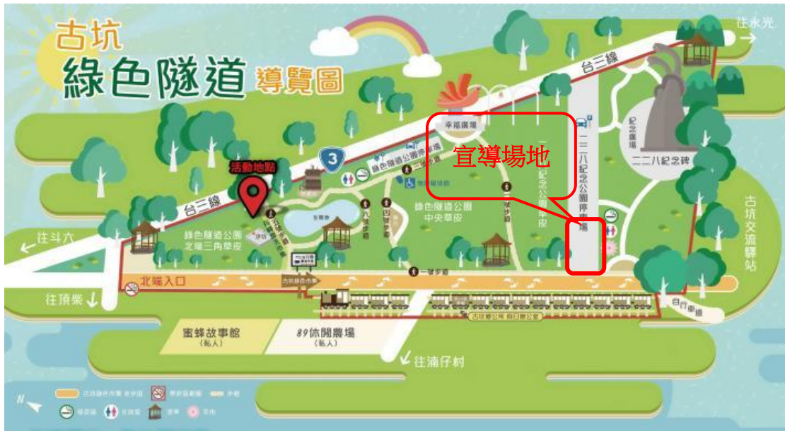
圖一 古坑綠色隧道宣導區域圖