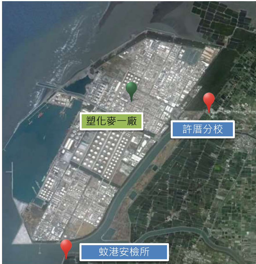
圖 4. 環保局石化監測車相關位置圖