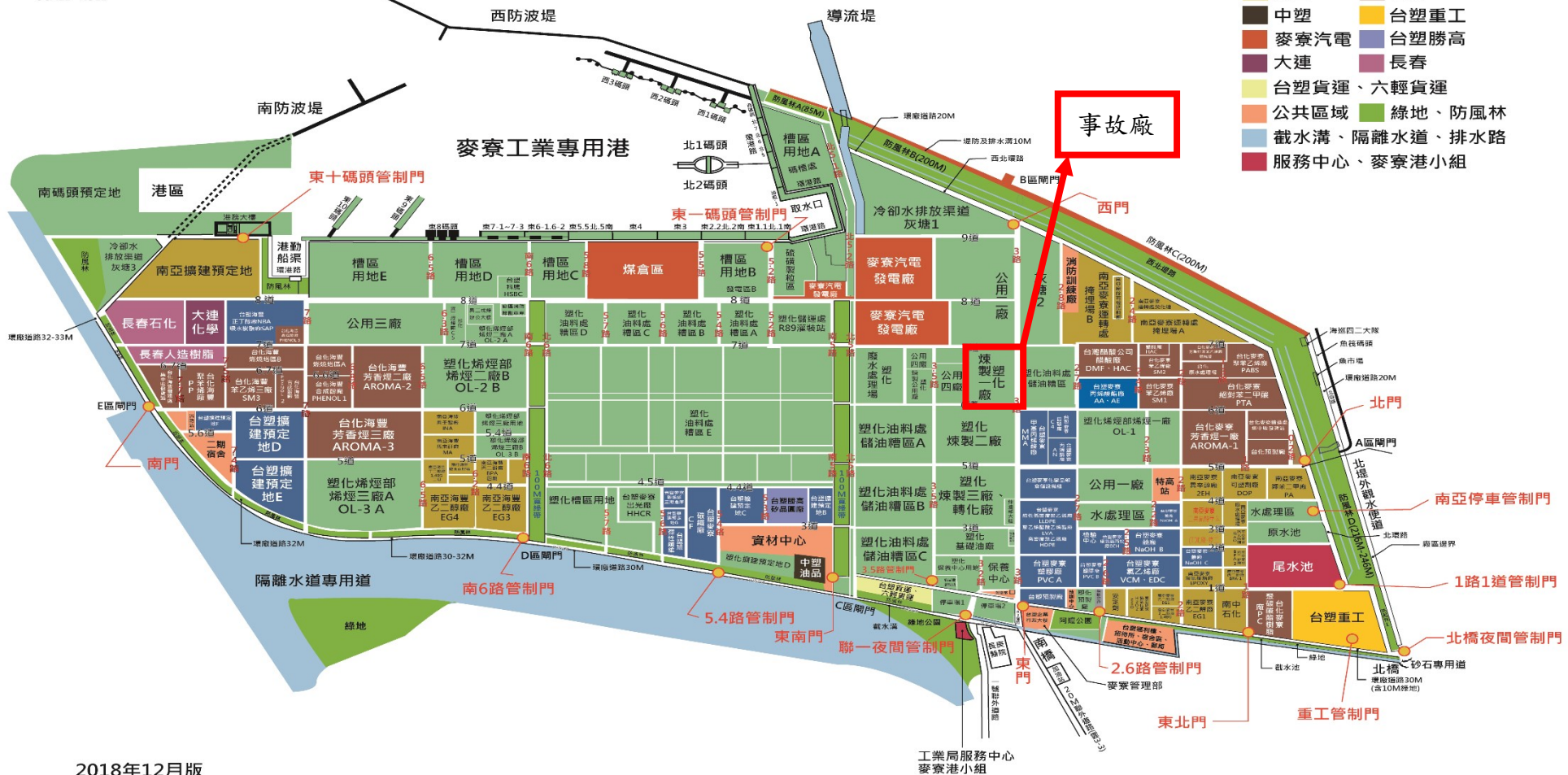
圖 1. 台塑石化股份有限公司麥寮一廠（輕油廠）位置