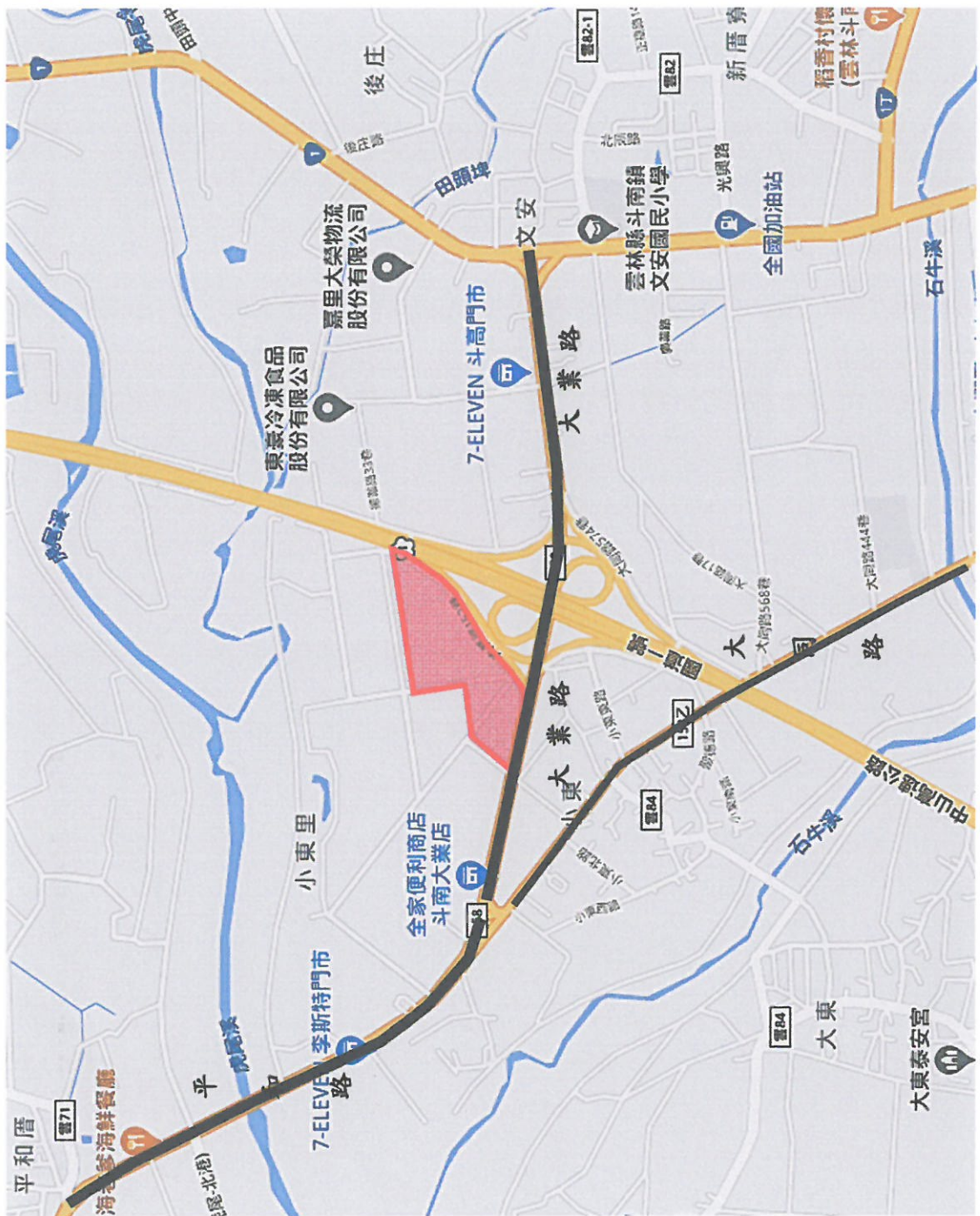
雲林縣斗南鎮大業自辦市地重劃區擬辦重劃範圍位置圖