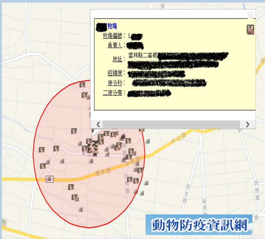
週邊風險場區管理