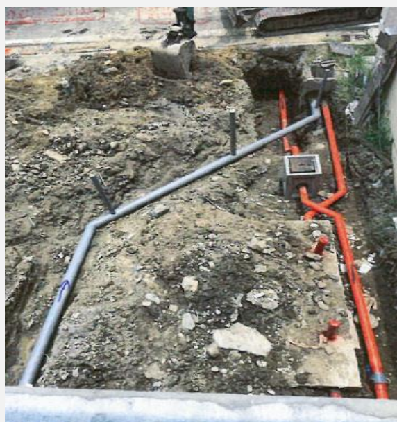
全區污水管線配置 (建議可由上往下拍攝)