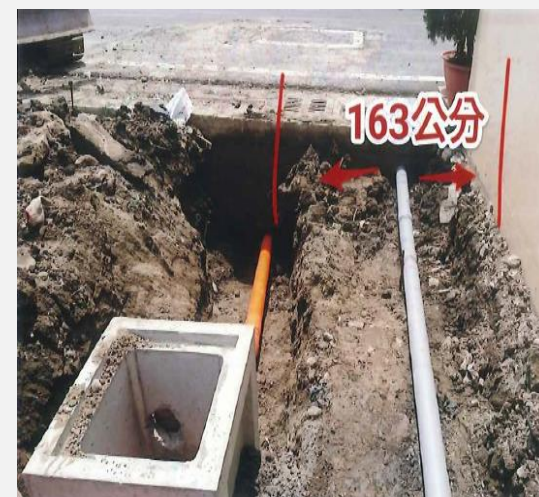
預留管相對位置(距離)