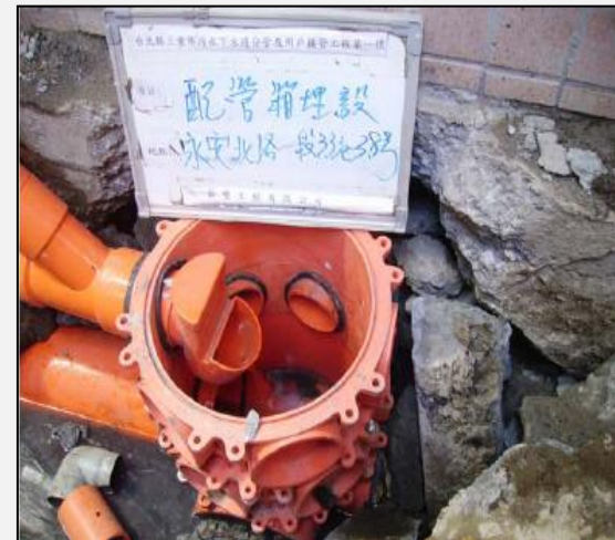
陰井 或 配管箱