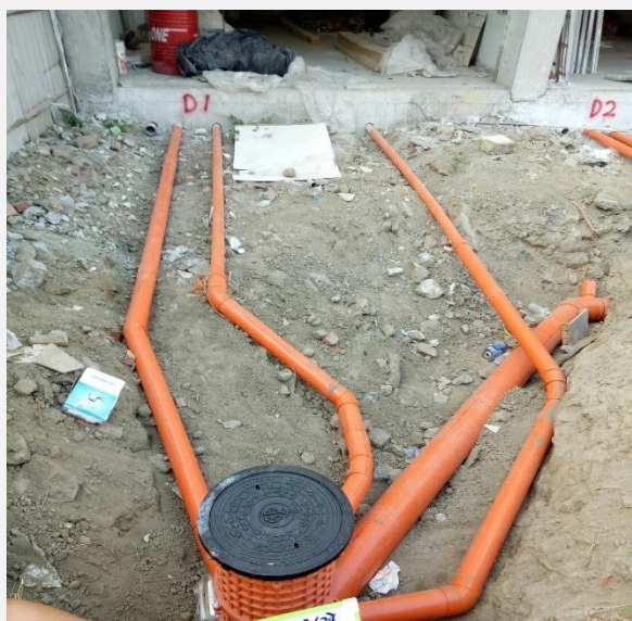
全區污水管線配置 (建議可由上往下拍攝)