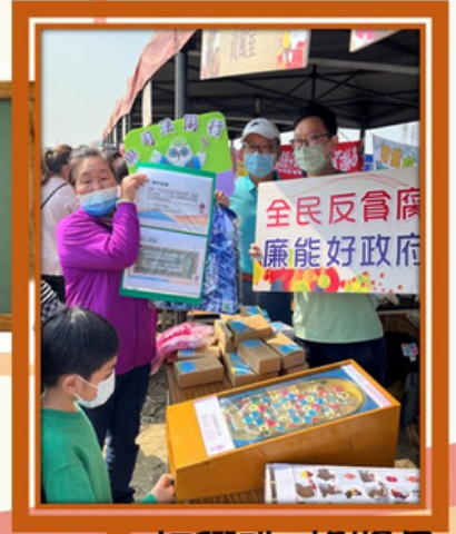
3. 打彈珠 換獎品