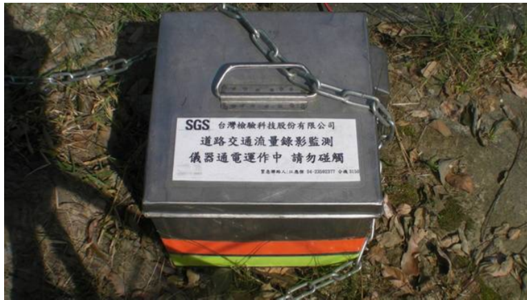
台灣檢驗科技公司貼說明，道路交通流量錄影監測運作中，請勿碰觸。