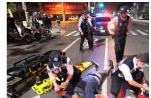
美男子倒臥血泊陷昏迷 警調監了真兇