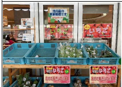
圖四、新鮮農特產品