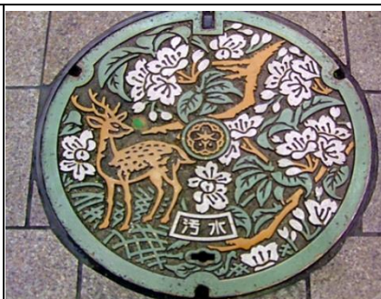
圖二、水溝蓋結合當地物產