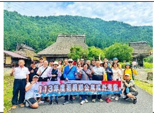
圖十二: 美山町合掌村