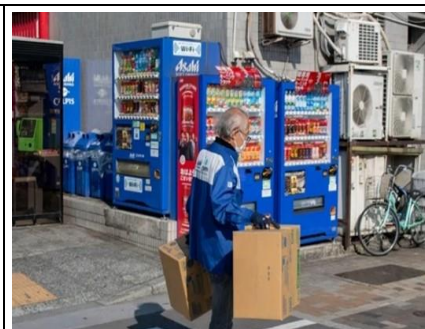
圖三、高齡員工工作情形