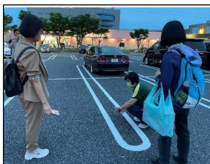
圖一、停車格劃設間隔設計

十、從日本街道整潔及垃圾桶設置可發現日本環保意識，日本街道上很少設置垃圾桶，如有設置垃圾桶，一般都會分類，而不能亂丟垃圾和丟垃圾時垃圾要分類的觀念，從小就在日本人的觀念中，日本垃圾基本上就會分為可燃垃圾、不可燃垃圾、保特瓶·鋁罐·玻璃瓶、紙類等等，這樣分類不僅提升了資源回收率還減少對環境的負擔，而日本環保教育從小做起值得我們借鏡及反思。(圖七)