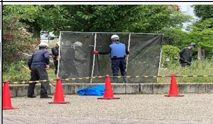
圖八、除草工作護網