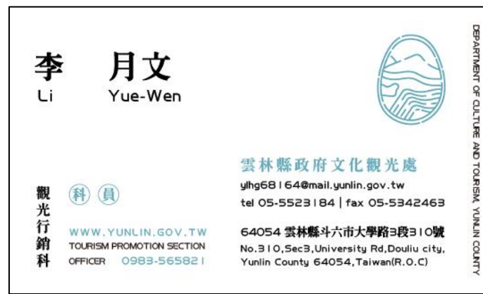
背面特2色 ( 純印刷 )