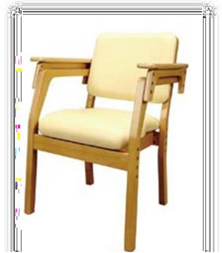
長年にわたり介護のプロに選ばれつづける「理由」