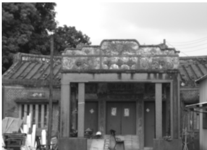
相片 4-04 張氏家廟

該宗祠原有門樓一座，曾懸掛張觀光之進士匾額，惜門樓毀於「九二一大地震」，據云該匾額目前存放於某族人處。