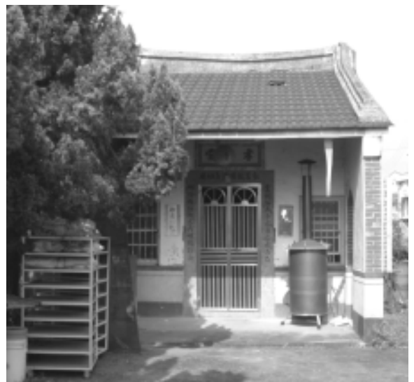
相片 4-06 楊氏公廳

創建於民國 60 年，為單體家廟形式。廳內供奉開台祖楊侃素(字宜文，祖籍漳州府龍溪縣，康熙末年來台)及歷代祖先神位，旁祀宋代忠烈楊家將六使公，每年冬至舉辦祭典。大門橫聯「弘農故國譜系姬周」，左右對聯「秉關西夫子之廉家風尚在」「明汾陽伯儒之義世德猶新」。據楊國燦(75歲)稱，該聯係吳景箕所作。