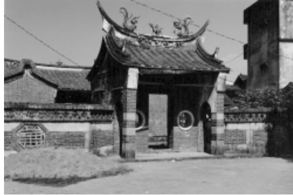
相片 4-07 何氏家廟，民國 88 年毀於「九二一」大地震。

院牆與院門…院門前後空間極為廣闊…內外木作構造精緻細膩，堪稱小巧秀麗的佳作」(註 41)。目前其族人商議籌劃重建。