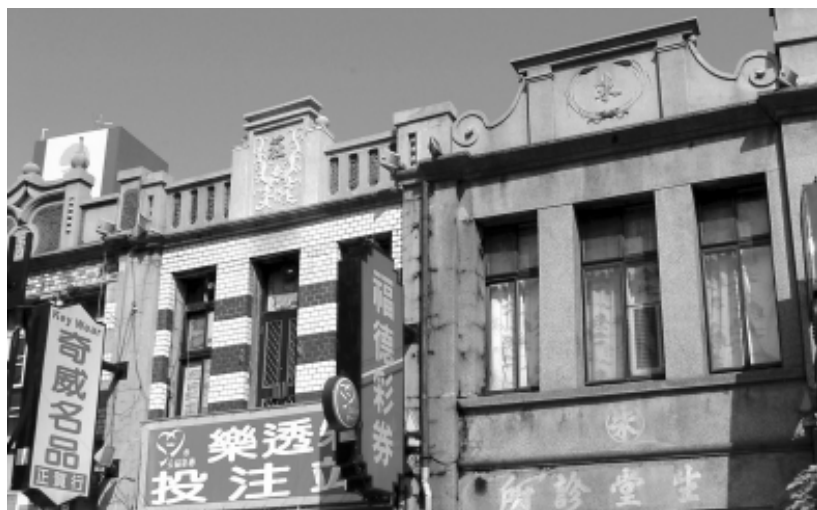
相片 4-01 太平街上建物多標示屋主姓氏。

華麗精美，充滿人文氣息而名聞遐爾。不少店家屋主在三樓女兒牆，以泥塑標示其姓氏，即以其自身所擁有之姓氏為榮。時至今日，雖有不少因店家屋主易人，而將原有泥塑姓氏標示予以塗掉，惟目前尚可見者如：郭：太平路 6 號、賴：同路 38 號、張：同路 61 號、蔡：同路 94 號、朱：同路 102 號、楊：149 號。有姓氏及堂號對聯者：謝：同路 108 號、李(原屋主應是姓張，因兩旁棟柱對聯，右聯「萬選青錢前世德」係紀念張鶯事蹟，左聯「千秋金鑑