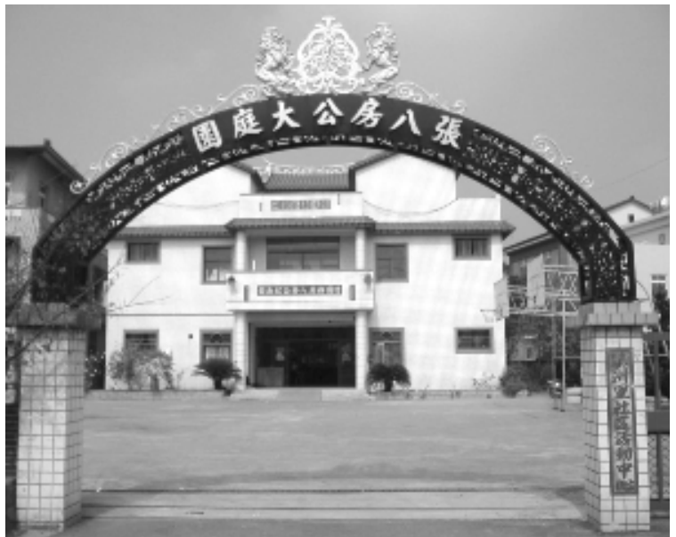
相片 4-03 張八房公紀念館

張八房公派下員人數眾多，今市長張和平亦屬其後裔。該公業之富冠於本市其他氏族，然「八房公」究竟為誰？有八位或排行第八？其姓名為何？經詢管理人及其他族親，均未能有完整答案(註 37)。