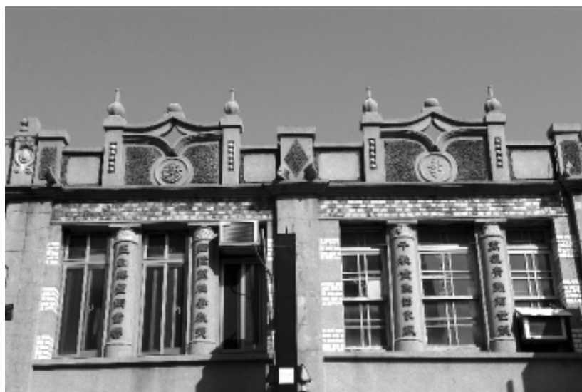
相片 4-02 太平街上建物亦有標示屋主姓氏及其堂號對聯者。