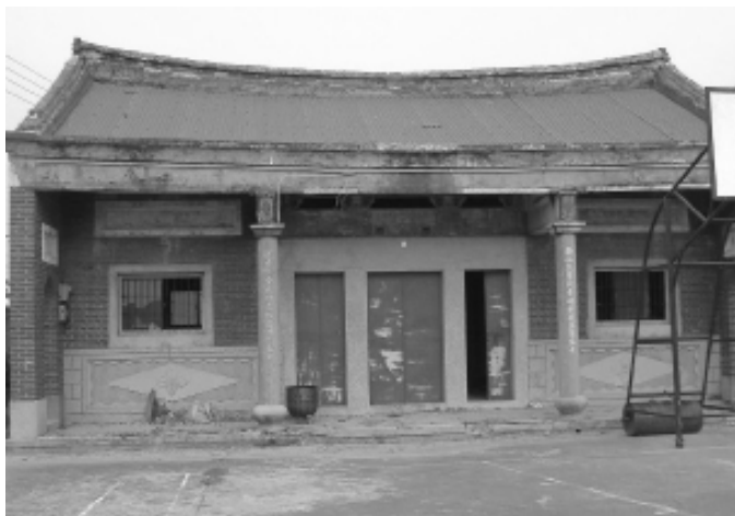
相片 4-05 林氏家廟

家廟內供奉十一世祖林國順牌位(即開台祖，其先一世祖為勤勞公，祖籍為漳州府南靖縣)。上方懸掛「西河衍派」匾，匾上有「甲戌年荔月(即民國23年六月)，裔孫有章立」字樣。大門左右對聯為：「西山芝草兆貞祥孝感華陽處士」「河內靈禽通顯應詔旒闕下林家」。華陽處士疑指宋人林逋，其以孝悌著稱，淡泊名利，博學多藝，人稱林處士；唐人林攢，孝感動天，有甘露三降白鳥再翔之瑞，德宗詔立其事於宮闕(宮殿)，以表其孝，世稱闕下林家。此家廟係由國順公派下長房及二房裔孫所共祀。