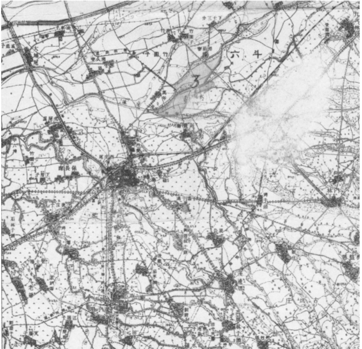
圖 6-04 西元 1926 斗六地形圖局部

以瓦；村莊則茅舍為多。雖存古樸之風，然易於失火。近有以桂竹剖破蓋屋者，耐久則不及瓦，而一易可七、八年。（倪贊元，1894）