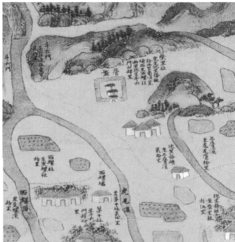
圖 6-02 康熙年間黃叔瓚繪康熙臺灣輿圖（局部）