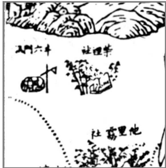
圖 6-01 西元 1719 年陳夢林修訂《諸羅縣志》蕃俗圖