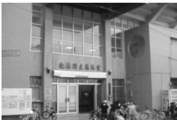
相片 8-76 雲林縣立游泳池

位於雲林縣斗六市警民街 38 號，於民國 73 年 7 月 22 日正式啓用，屬雲林縣立體育場。