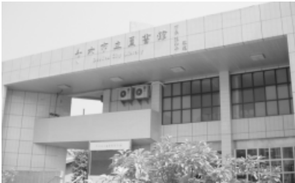
相片8-71 斗六市立圖書館