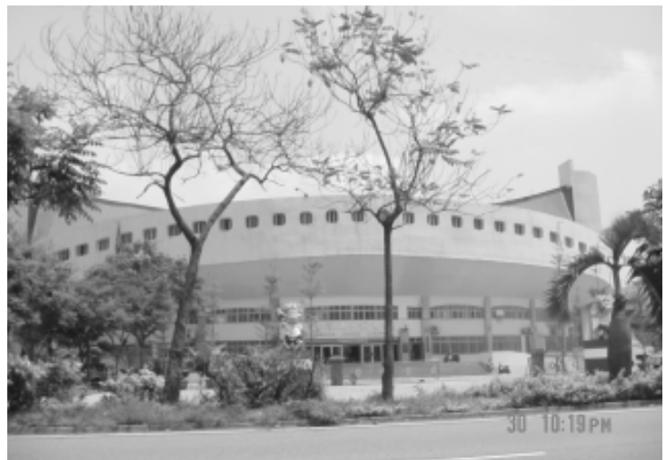
相片8-74 雲林縣立體育館

位於雲林縣斗六市大學路三段600號，於民國74年啓用，每年場館租約收入大約在新台幣1,800,000元左右。體育館基地面積20,