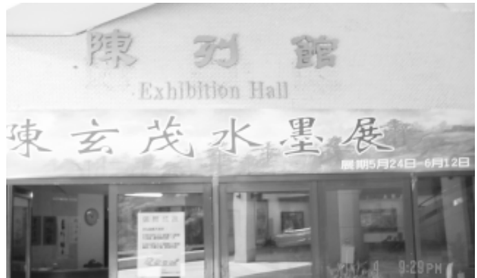
相片 8-67 文化局陳列館