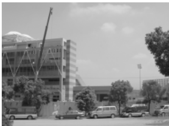
相片 8-78 興建中的雲林國際棒球場

雲林縣爭取到民國94年全國運動會主辦權後，於民國 92 年 10 月在斗六市西北郊興建國際標準棒球場，94 年完工。這是繼台北、高雄、花蓮之外，台灣中部地區唯一符合國際標準的棒球場，每年預計舉辦 60 場次的職棒賽，看台下方將規劃為中部地區農特產品展售