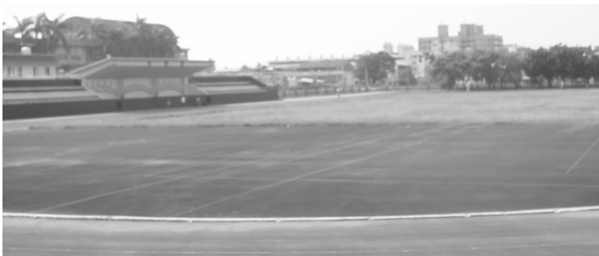
相片 8-77 斗六市立體育館

設立於民國 48 年，位於斗六市鎮東國小內，因建設年代久遠，設備老舊，影響體育活