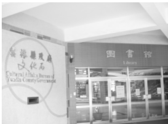
相片 8-68 圖書館

視聽圖書室、研習室、視聽室、會議室、行政辦公室等設施。藏書約 50,000 餘冊，民國 94 年 5 月，張和平市長鑑於國民科學教育滑落 50%，因此為提供民眾更多元化知識，開放了以典藏自然科學性錄影帶和光碟為主的博物館圖書室。