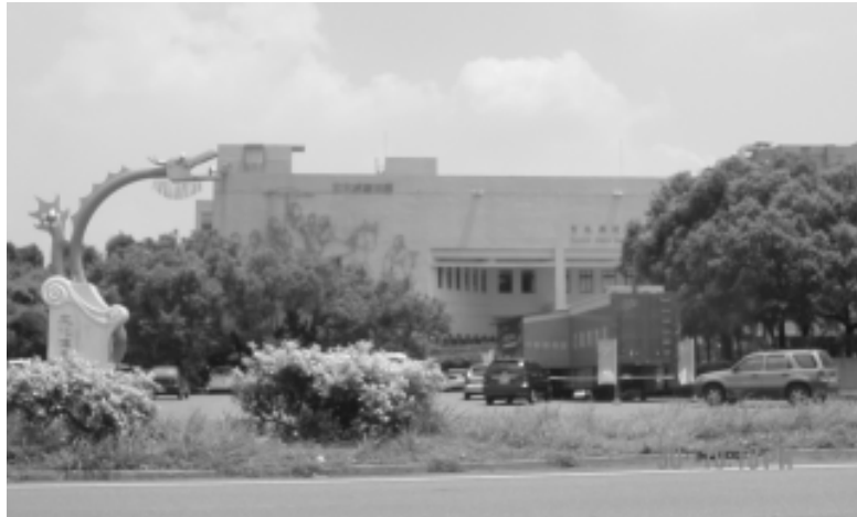
相片8-64 雲林縣政府文化局

文化局陳列館計有3層樓，建坪1,051坪。為多元性用途之展示區，舉凡民俗文物、雕刻、插花、攝影、陶瓷等均可在此展出，平均每月有2至4次的各項專題展。畫廊部份主供展示美術作品之用，而以邀請展或借展性質居多。