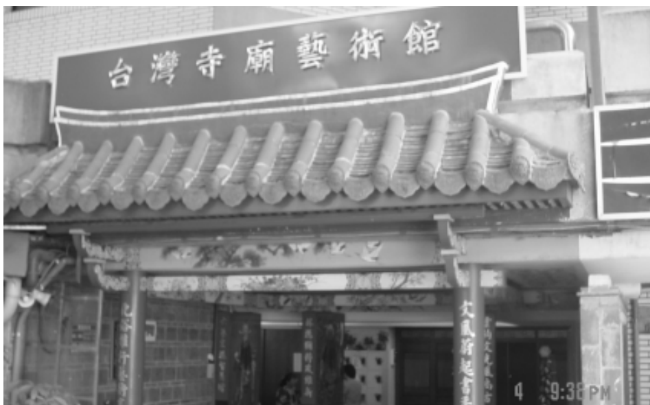
相片 8-70 台灣寺廟藝術館