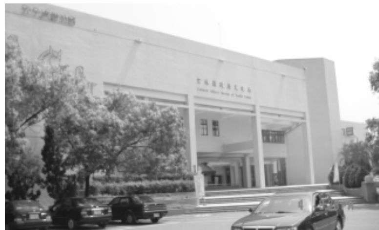
相片8-65 雲林縣政府文化局