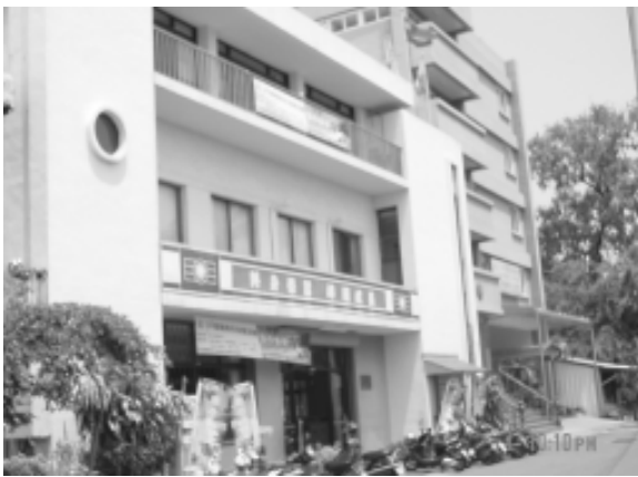
相片 8-73 中國青年救國團

救國團雲林縣團委會位於雲林縣斗六市府前街58號，成立於民國49年，並於民國75年設立社會教育中心，舉辦社會教育研習營。中國青年救國團配合政府「推展終身教育、建立學習社會」的政策，積極倡導終身學習，建立社區義務指導教師制度、發行終身學習卡、增設終身學習場所，提供兒童、青少年、婦女、工商青年、銀髮族一系列社會教育之課程，並協助政府推展全民學習外語列車、成人基本教育班、婦女、勞工學苑、讀書會以及職業證照制度，也接受社政單位、工商企業委辦各項教育訓練活動。民國90年10月獲得行政院人事行政局認證為「公務人員終身學習之機構」，現在終身學習已成為社區民眾生活的重心，更成為廿一世紀的全民運動。（雲林縣救國團網站）