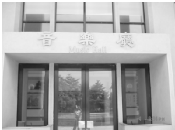
相片 8-69 音樂廳

文化局音樂廳自民國 75 年動工至民國 76 年完工，建坪 1,803 坪，包括大廳、觀眾席 938 位、貴賓休息室、舞台、演員化粧室、放映室、燈光控制室、音響控制室、演講廳、並有電腦燈光、音響、布幕吊具及空調設備等。