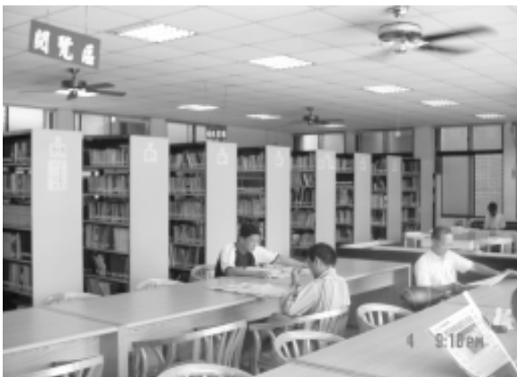
相片8-72 圖書館內一角