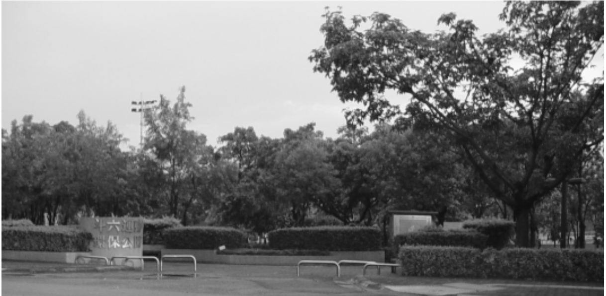
相片 8-89 斗六運動環保公園

位於斗六市大學路三段 600 號，由行政院環保署補助經費約新台幣 10,000,000 餘元，雲林縣政府提供建地，民國 86 年完工，為斗六休閒運動之好地方。