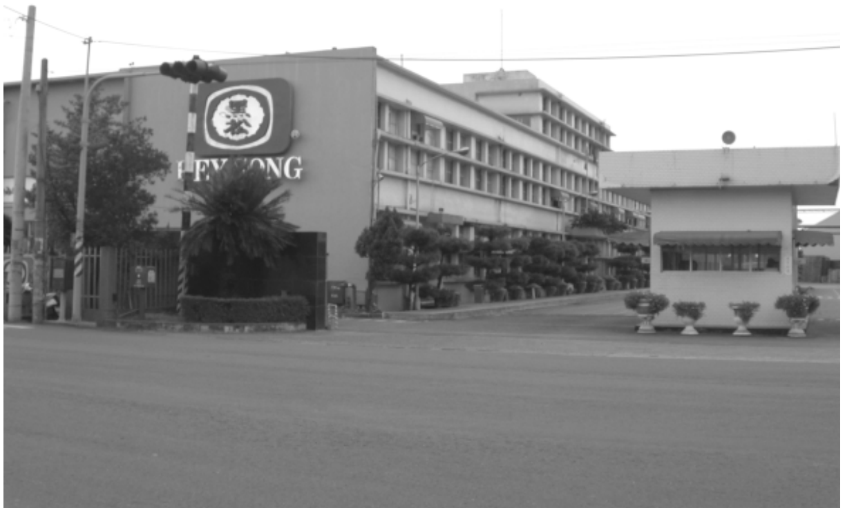
黑松股份有限公司

黑松股份有限公司斗六廠位於斗六市文化路 635 號，大門面對 3 號省道公路，往來交通便捷，全廠面積 24,186 坪，目前員工人數 148 人。從民國 61 年開始啓用以來，就一直致力於產品的多樣化，碳酸飲料、果汁、咖啡為大宗，尤其果汁的生產是斗六廠最具特色的一環，所生產的芭樂汁、楊桃汁是採用百分之百完全自製原汁，黑松並與當地果農簽約，以保障果汁原料的來源。但這項和農民連續 27 年的合作關係到 2001 年底終止，因為大環境的不景氣，致使總公司不得不以外購節省成本的方式取得果汁來源。