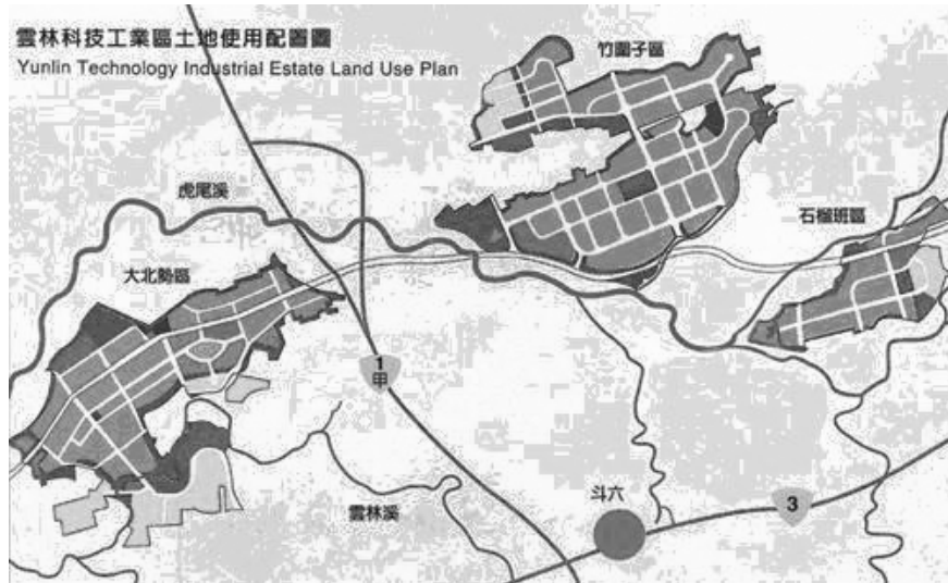
圖 5-5 雲林科技工業區土地使用配置圖

(2) 竹圍子區：南臨虎尾溪，區內有台糖運蔗鐵路穿越，面積約 276 公頃。經濟部工業局為配合「擴大內需方案」，特編定本區為絲