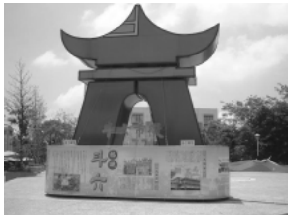
相片 2-23 斗六門市徽（攝於斗六市中山公園）

乾隆初年（西元1739年），泉州人楊仲熹等人，招集漢人開始爲此地積極進行建設街肆之基礎開店行商，並於清乾隆17年（西元1752年）已大略形成市街之雛形；清乾隆25年（西元1760年）時續修《台灣府志》斗六已作爲「保」