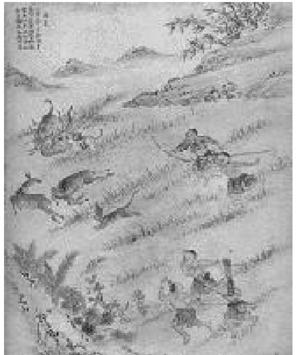
圖2-40 取自清·《番社采風圖》捕鹿