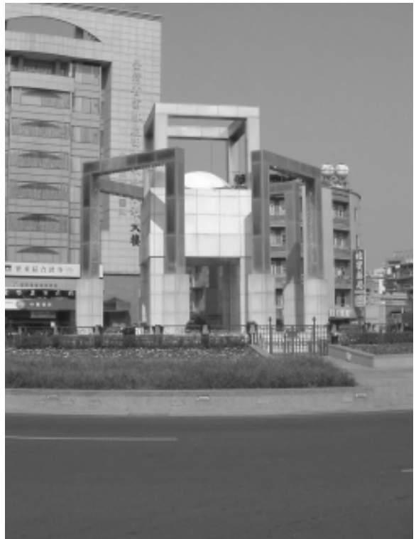
相片 9-198 水舞景觀雕塑