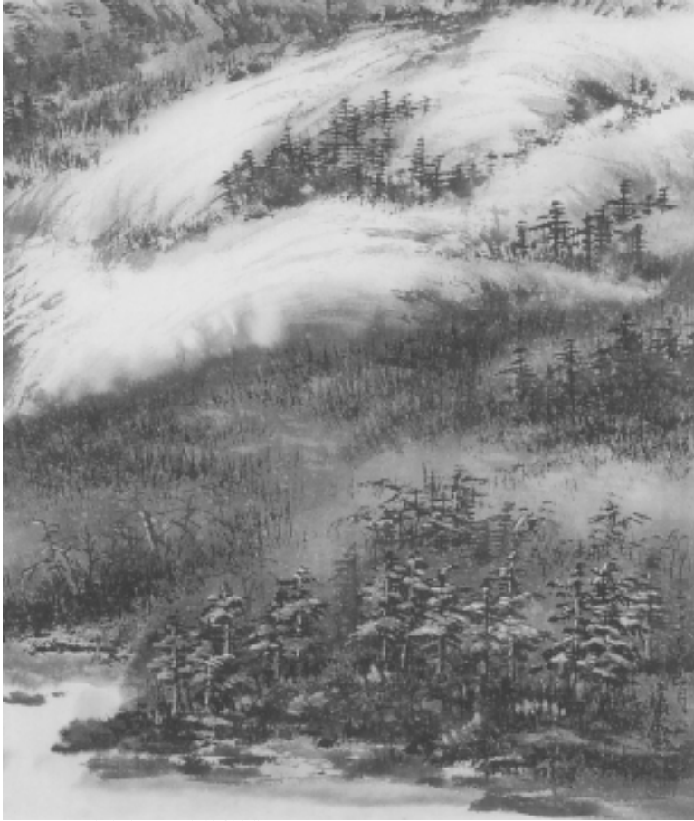
圖9-79 嶺上初雪—劉靜枝作品