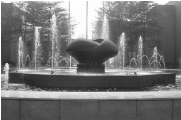
相片 9-194 雲科大噴水池

17. 雲林國小：F.R.P（玻璃纖維）作品「圓融」、「圓的禮讚」、「親情」、「圓舞曲」（邱泰洋，1996）；F.R.P（玻璃纖維）作品「水牛群像」（黃土水之複製浮雕，1997）