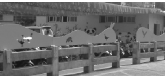
相片9-189 雲林溪觀光街橋面