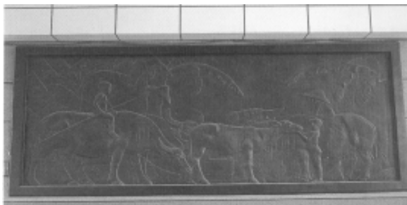
相片 9-196

18. 人文公園入口：黑色大花崗石構造，以英文字造型代表「雲林縣」（Yun Lin）（2004）