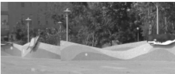
相片9-188 斗六公園「波浪圍牆」

13. 內環路「斗六公園」親水區：馬賽克與金屬造型作品「波浪圍牆」(蔡志英，2004)