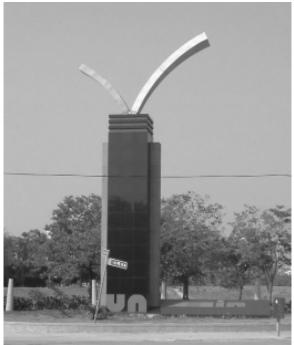
相片 9-197 人文公園入口

18. 人文公園入口：黑色大花崗石構造，以英文字造型代表「雲林縣」（Yun Lin）（2004）