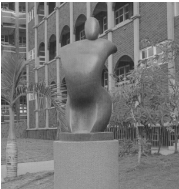
相片 9-195

17. 雲林國小：F.R.P（玻璃纖維）作品「圓融」、「圓的禮讚」、「親情」、「圓舞曲」（邱泰洋，1996）；F.R.P（玻璃纖維）作品「水牛群像」（黃土水之複製浮雕，1997）