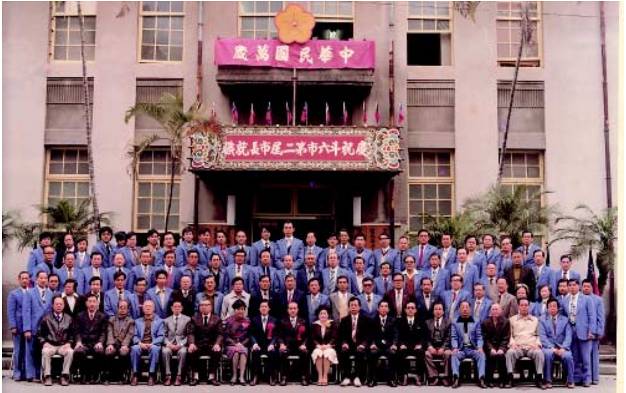
斗六市第二屆市長移交典禮紀念

1981年7月17日根據修正「台灣各縣市實施地方自治綱要」之規定，1981年12月25日，雲林縣斗六鎮改為斗六市。（註36）