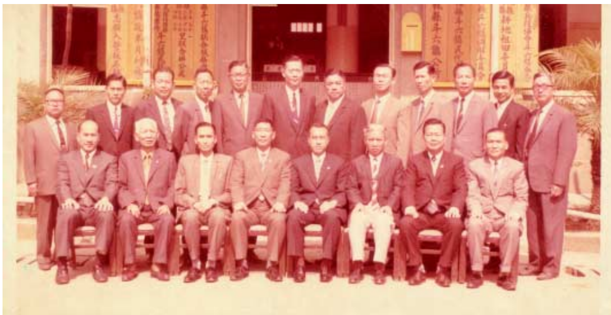
斗六鎮公所主管合影紀念