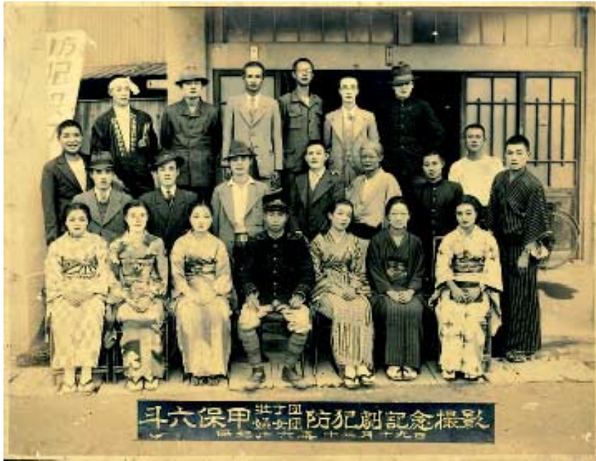
斗六保甲防犯劇紀念攝影(昭和16年攝)