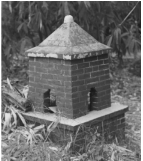
梅林里福德宮舊址