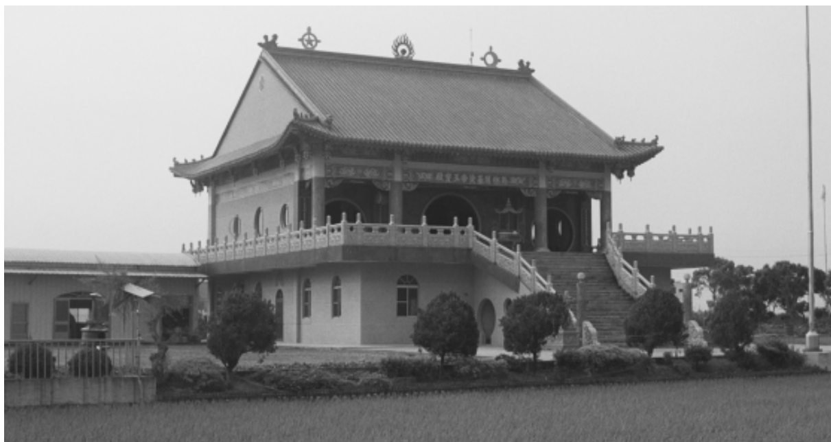
無極開基黃帝玉寶殿