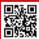
雲林縣政府 文化觀光處