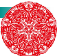
▲蘇秦村蝙蝠相紙浮雕特展