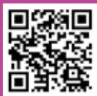
雲林縣政府 文化觀光處