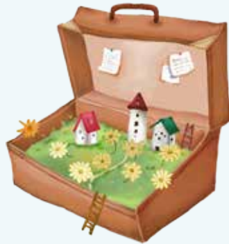
※以上徵選活動若調整將於文化觀光處網站公布，並以實際現場為主。