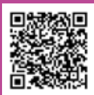
雲林縣政府 文化觀光處FB