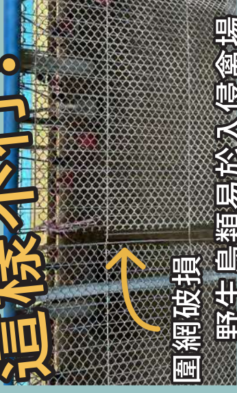
圍網破損 野生鳥類易於入侵禽場