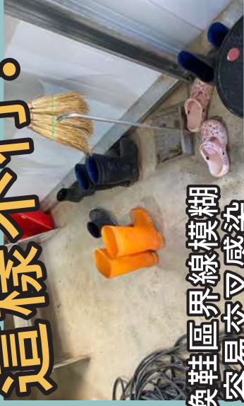
換鞋區界線模糊 容易交叉感染