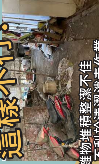
雜物堆積整潔不佳 不利於清潔消毒作業