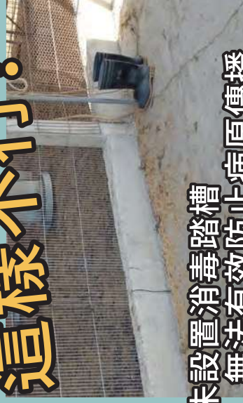
未設置消毒踏槽 無法有效防止病原傳播