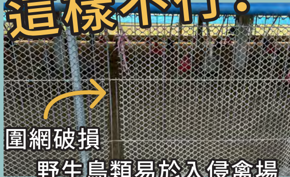
圍網破損 野生鳥類易於入侵禽場