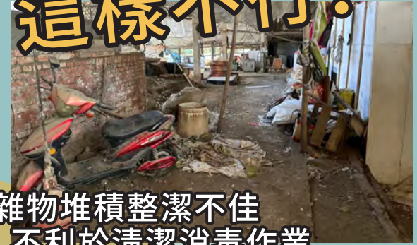
雜物堆積整潔不佳 不利於清潔消毒作業