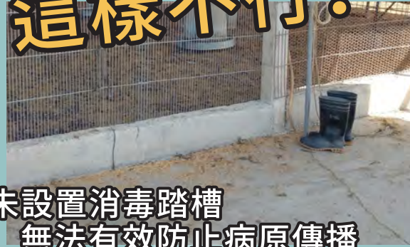
未設置消毒踏槽 無法有效防止病原傳播