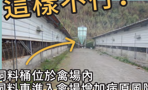
飼料桶位於禽場內 飼料車進入禽場增加病原風險