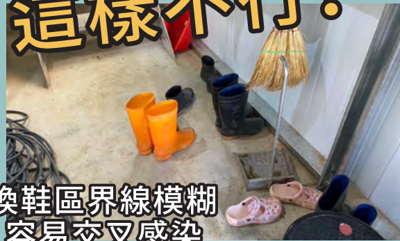
換鞋區界線模糊 容易交叉感染